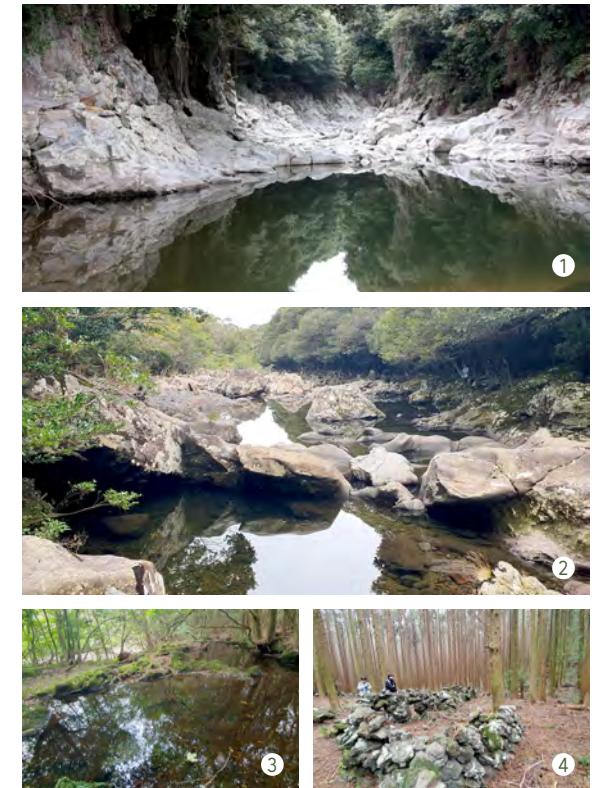
① 효돈천 계곡의 올레낭굴 호수 ② 서중천 계곡 ③ 서중천 계곡의 습지 ④ 마세왓 목축문화재